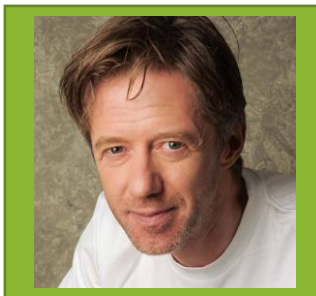
Jiří Langmajer – herec