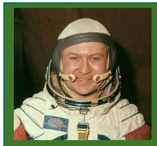
Vladimír Remek – kosmonaut

Následně vše zkompletujeme a doplněné nesouhlasnými stanovisky od MČ Troja, MČ Praha 8, Botanické zahrady, Zoologické zahrady, Institutu plánování a rozvoje hl. m. Prahy a Ministerstva životního prostředí, předáme na podatelnu na Magistrát hl. města Prahy k dalšímu kroku.